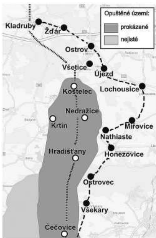
Opuštěné území (stav k roku 1239)

Břetislav využil pravděpodobně přivedeného obyvatelstva z těchto spálených vesnic k rychlému a nečekanému postavení zátarasů u oné staré cesty a poté k drtivé