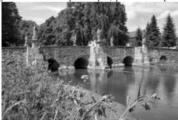
Foto: Barokní most v Bělé nad Radbuzou

Dále pak pokračuje po stejné zelené značce přes Kopec, pod hradem přes most vede do Prostiboře a Darmyšlu. Pohoří Sedmihoří přechází pohodlnou, velice starou, v kamenitém terénu vytesanou cestou, takřka stále vedenou převážně po vrstevnici, do vsi Vidice. Odtud se otáčí na jih přes Mělnici, Hostouň s kostelem sv. Jakuba, Újezd sv. Kříže a opět se stáčí k severu do Bělé nad Radbuzou. Tam přechází přes známý historický most se sochami