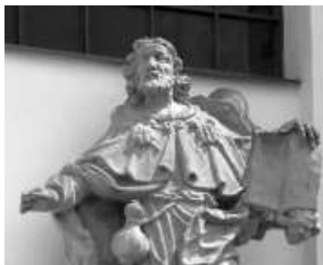
Foto: Sv. Jakub (detail sochy v Kladrubech)

katedrále se několik staletí nacházela jeho socha s mečem, na níž byl zobrazen jako nesmířitelný bojovník za ideály křesťanské církve. V posledních letech, vzhledem k mnoha teroristickým útokům v některých státech západní Evropy,