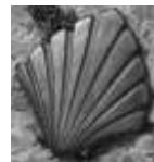
Foto: Mušle hřebenatky

byla z obavy o její zničení přemístěna do muzea, aby se snad nestala terčem ničení. Byla nahrazena sochou téhož světce, která symbolizuje sv. Jakuba Většího jako patrona poutníků s pláštěnkou, brašnou a nádobou na vodu – asi tak, jak ji vidíme i v průčelí našeho kostela sv. Jakuba Většího v Kladrubech. Atributem (stálým znakem pro jeho zobrazování) sv. Jakuba je mušle, konkrétně lastura mlže